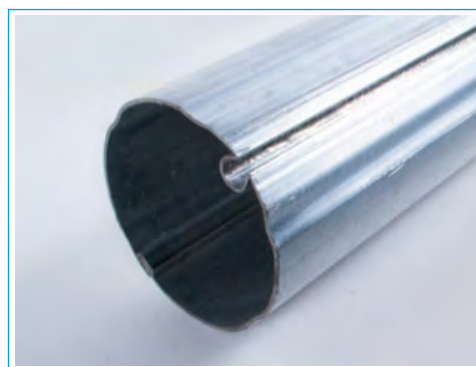
TUBO DE ENROLLE 80 MM